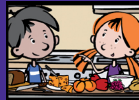
Selber kochen für kleine Gäste Zubereitung von einfachen Speisen