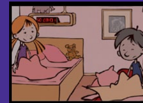
Wie verschlafe ich einen Mathe-Test? Schlaf und Gesundheit