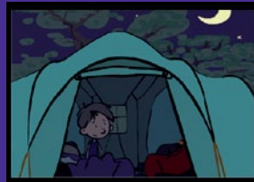
Die Süßigkeiten-Nacht Gesunde Zähne