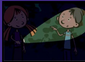
Gut geschnüffelt Sinne