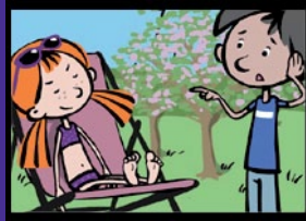
Dunkelbraun und Sommer- sprossen Sonnenschutz