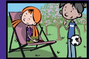
Achterbahn der Gefühle Gefühle und Sozialkompetenz

Kaufen Sie alle Module zum attraktiven Paketpreis. Hosting ist auf Anfrage möglich. Verschaffen Sie sich einen Eindruck unter: www.im-c.de/lernspiele