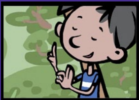
Die große Zahn-Quizshow Meine Zähne