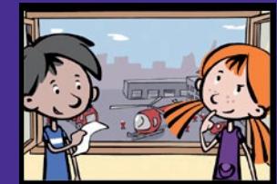
Der Feuerwehr-Wettbewerb Feuergefahr und Notsituationen