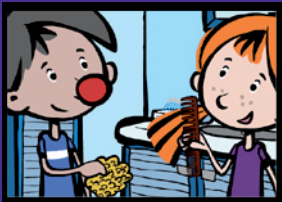
Zähneputzen mit Kamm und Schwamm Zahnpflege