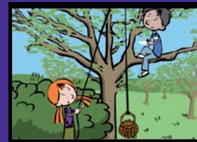
Kater Samson in Gefahr Gesunde Ernährung