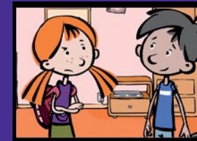
Ein Ranzen auf dem Laufsteg Gesunde Körperhaltung