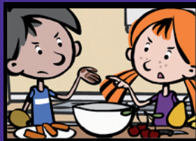
Obstsalat mit Schnupfen Waschen und Hygiene