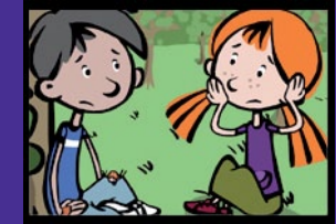
Stolperfalle mit Bienenstich Versorgung kleiner Wunden