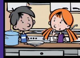
Die Frühstücksdetektive Herkunft und Verarbeitung von Lebensmitteln