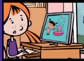
Computerhunde Medienkonsum und Freizeit- gestaltung