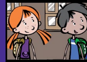
Stadtsafari mit Straßenplan Orientierung und Verhalten im Straßenverkehr