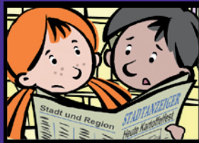
Auf zum Kartoffelfest Angemessene Kleidung